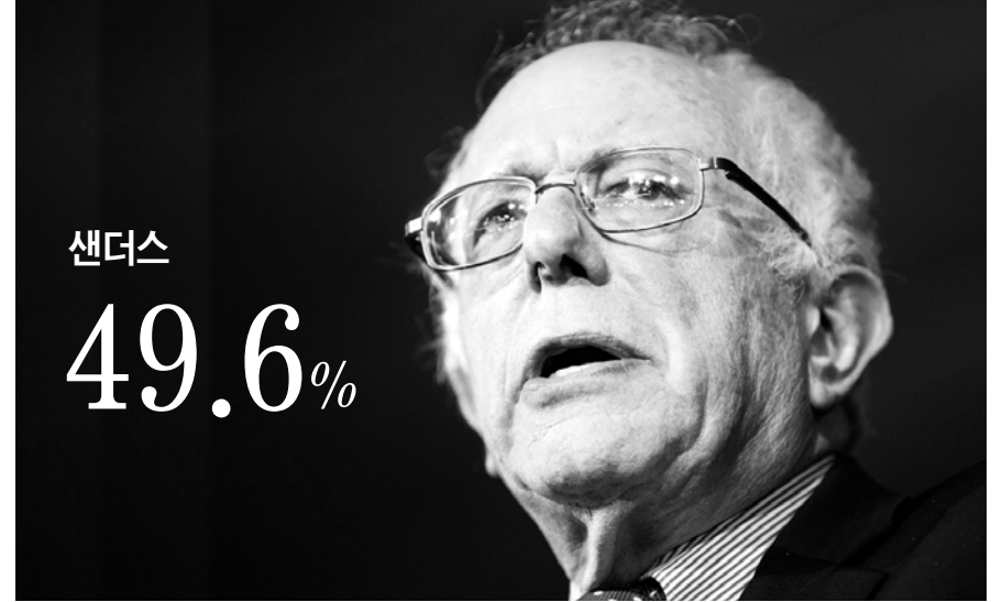
미국 대선 첫 관문인 1일(현지시간) 아이오와 코커스(당원대회)에서 간발의 차로 샌더스를 앞선 민주당의 힐러리 클린턴 전 국무장관이 디모인 소재 드레이크 대학에서 연설하고 있다.