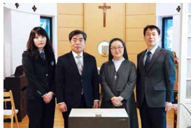
광주세관 행복나눔봉사단은 3일 아동보호시설인 '광주나자렛집'과 소년가장 그룹홈 '길사랑' 등 사회복지시설 등을 방문해 생활용품과 성금을 전달했다.