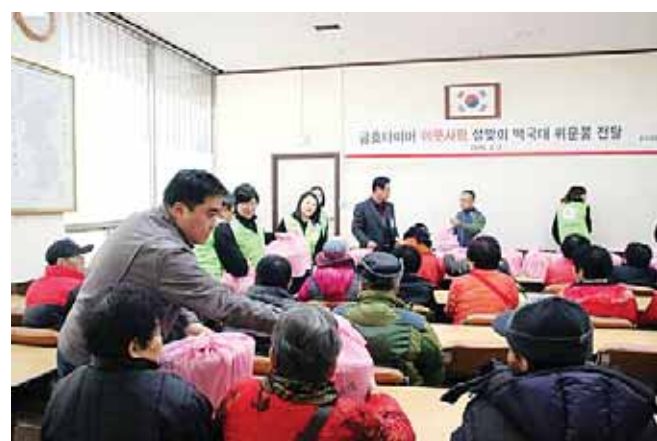
금호타이어 임·직원들은 지난 2일 설을 맞아 광주시 광산구 어룡동주민센터(동장 정종범)를 방문해 지역 어르신들께 제수용품을 전달했다.