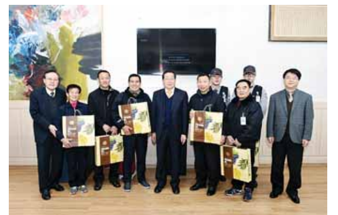
서재홍 조선대학교 총장은 3일 총장실에서 환경미화원과 경비요원 228명에게 식용유 세트 등 설 명절 선물을 전달하고 격려했다.