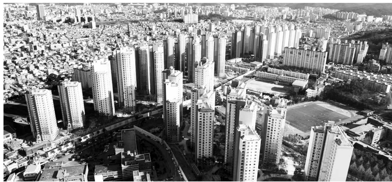
광주 화정동 유니버시아드 선수촌 아파트 전경.