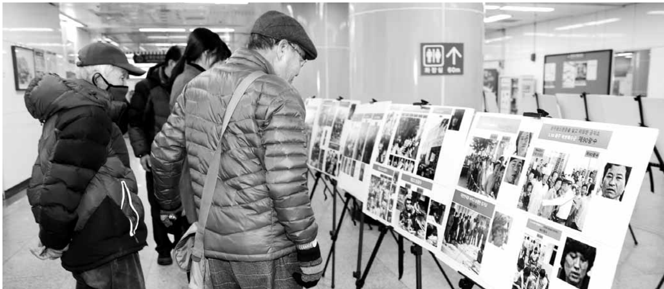
"5·18 사진 속 시민 찾아오" 광주시시철도공사(사장 정선수)와 5·18기념재단(이사장 차명석)은 남광주역과 금남로471역 등에서 역사 왜곡을 바로잡기 위한 '5·18 당시 사진속 광주시민찾기' 전시를 다음달 말까지 진행한다.

앞으로도 시는 청소년들의 균형 있는 성장을 위해 다양한 체험과 문화 활동 등 역량강화를 위한 우수 프로그램을 개발하고, 저소득가정 및 근로청소년 장학금 지원, 청소년시설 확충 등 청소년들에게 안전하고 친화적인 환경을 조성할 계획이다. /채희종기자 chae@kwangju.co.kr