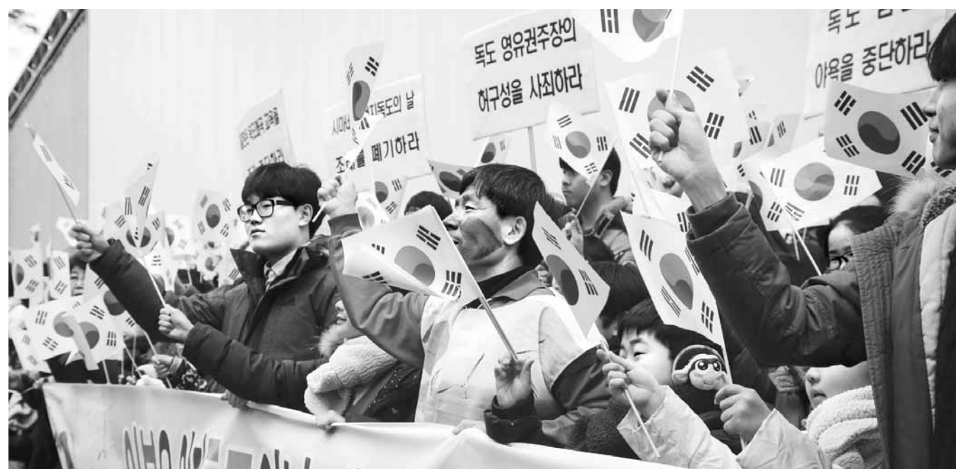
다케시마의 날 지정 규탄 22일 독도살리기운동본부가 서울 종로구 구(舊) 일본대사관 앞 평화비(소녀상) 부근에서 다케시마의 날 지정을 규탄하는 문화제를 하고 있다. /연합뉴스

담양을 비롯한 29개 기초지자체가 7% 이상 10% 미만, 광주 남구 등 비롯한 55개 기초지자체가 4.47% 이상 7% 미만의 지가 상승률을 보였다. /윤현석기자 chadol@