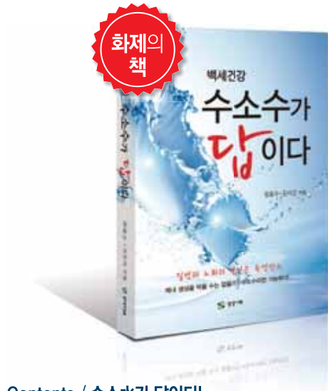
수소수가 답이다 지음 임동수·김서곤 출판사 상상나무 200쪽 | 값 13,500원

수소가 선택적으로 독성산소의 상해로부터 세포를 지킨다 - Nature Medicine 저널 발표