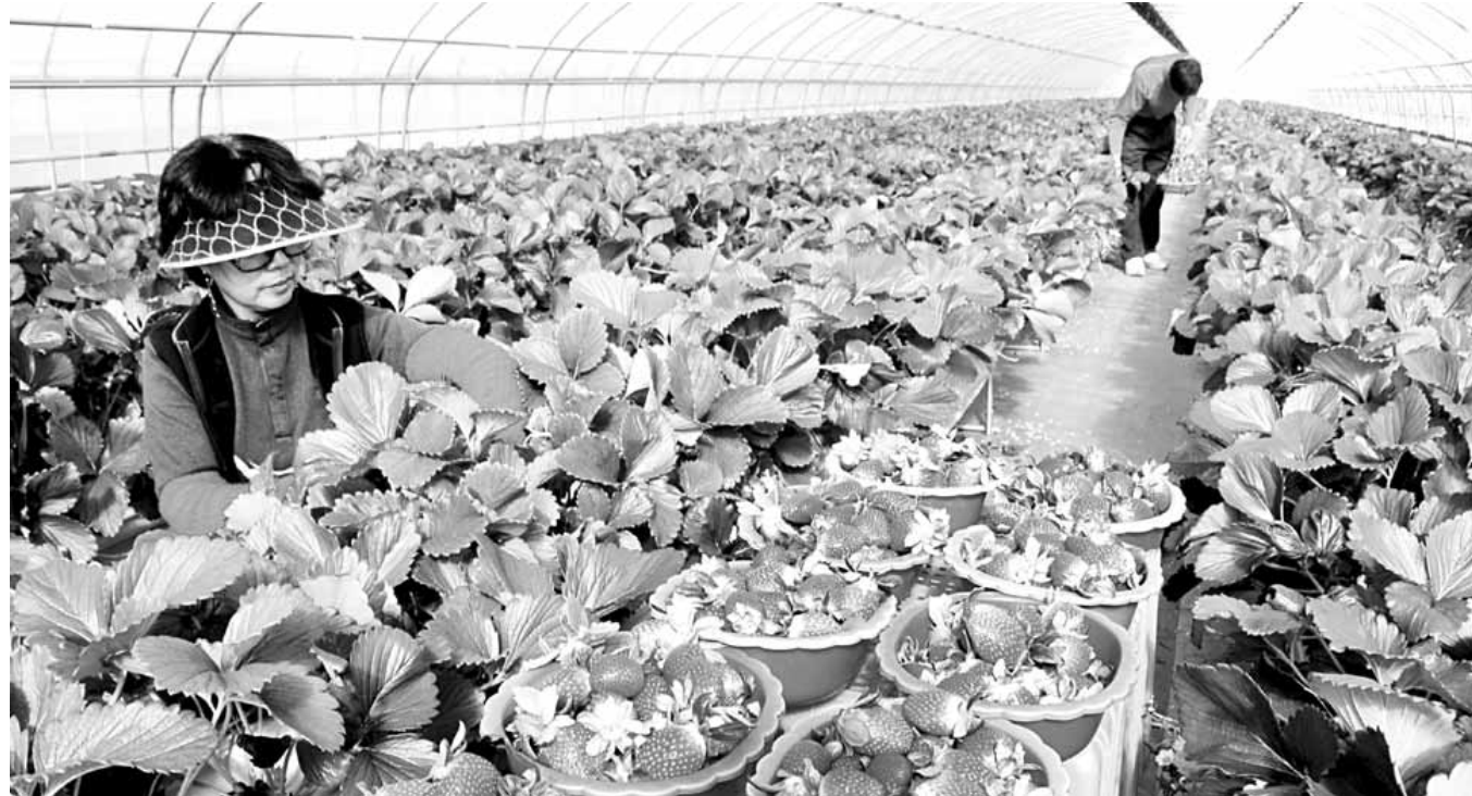
홍콩 가는 '대숲맑은 담양 딸기' 담양지역 대표 농산물인 '대숲맑은 담양 딸기'를 출하하는 농민들의 손길이 분주하다. 새콤달콤한 맛과 향이 특징인 '대숲맑은 담양 딸기'는 국내는 물론 홍콩 야타백화점과 웰컴 마트에 진출하는 등 세계인의 입맛을 사로잡고 있다.

대나무의 고장 담양군은 2일 "대나무와 현대적 디자인을 접목한 창작품 발굴을 위해 제35회 전국 대나무(디자인)공예대전을 개최한다"고 밝혔다. 담양 대나무자연연구소는 3일부터 4월 22일까지 출품신청서를 교부하며, 참가희망자는 4월 21~22일 담양군 대나무자연연구소(한국대나무박물관)를 방문해 신청서와 함께 실물 작품을 제출하면 된다. 출품작은 심사위원회의 1차 심사와 본 심사를 거쳐지며, 수상작은 대나무축제 기간 동안 전시된다. 심사위원들은 출품작의 조형성과 창의성을 비롯한 실용성과 상품화 가능성, 양산성 등 대나무의 산업화 가능성에 중점을 두고 심사할 계획이다. 다만 국내외에서 이미 상품화가 됐거나 타 공모전에 출품해 입상한 작품, 다른 작품을 표절한 것으로 인정되는 작품 등은 출품이 제한되며, 수입 원자재를 30%이상 사용한 제품도 출품 자격이 제한된다. 기타 공예대전에 대한 문의는 담양군 대나무자연연구소(061-380-2902)로 하면 자세하게 안내 받을 수 있다. 담양군 관계자는 "5월 3일부터 8일까지 열리는 대나무축제를 맞아 우수 대나무 공예품을 발굴하고 공예인의 창작의욕을 높이기 위해 대나무 공예대전을 마련했다"고 밝혔다. /담양=정재근기자 jrg@