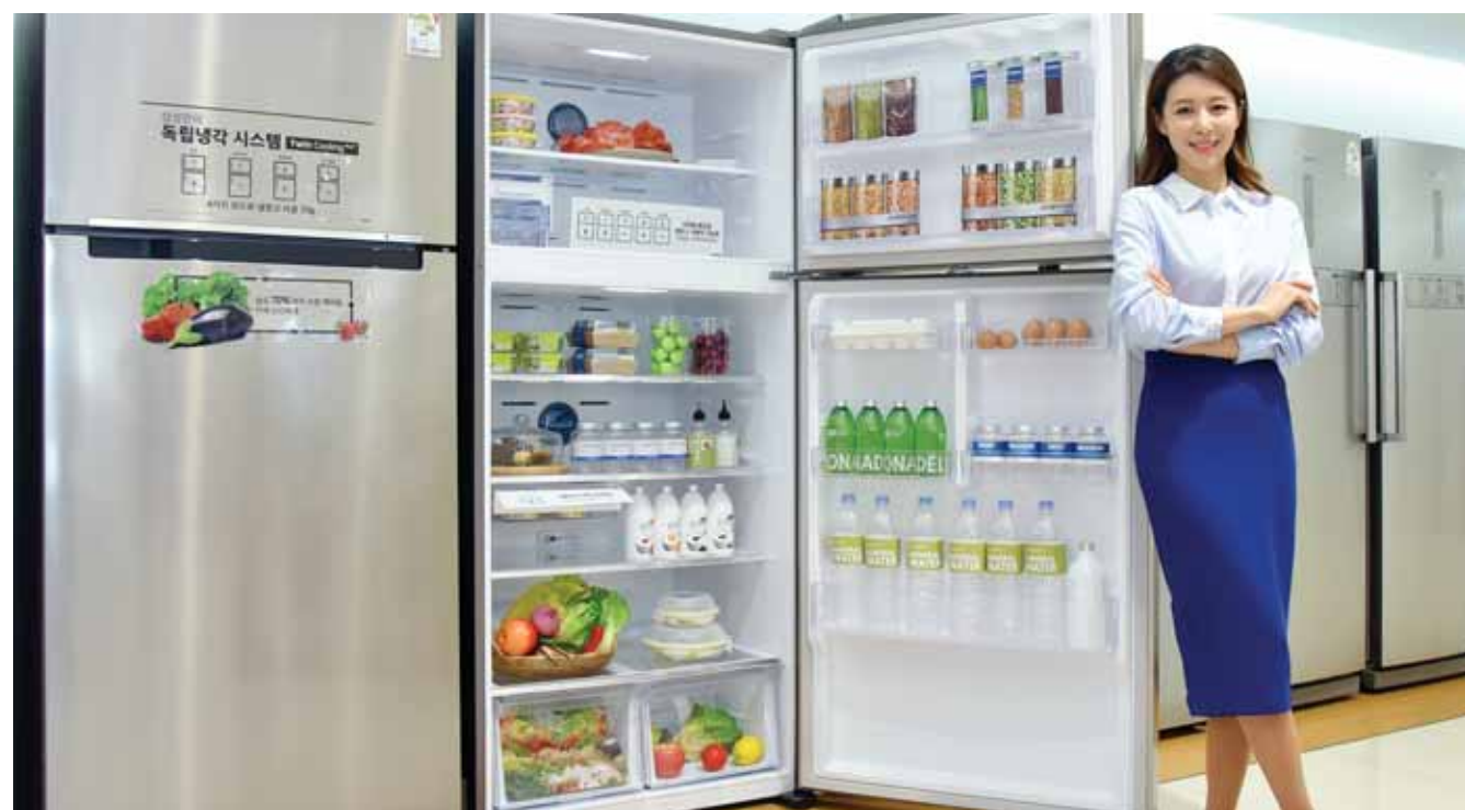
삼성, 상냉동 하냉장 신모델 출시 삼성전자 모델이 6일 논현동 삼성 디지털프라자 강남본점에서 상냉동 하냉장 타입의 2016년형 'TMF(Top-Mounted Freezer) 냉장고' 신모델을 소개하고 있다. 신모델은 '지펠 T9000'과 '지펠 푸드쇼케이스' 등 프리미엄 냉장고에 주로 적용해온 삼성전자만의 독립냉각 시스템을 일반 냉장고에 확대했다.

hi 지역인재에 대해선 서류전형과 면접 원해불만하다. 때 3%의 가산점이 인센티브로 제공돼 지 /김대성기자 bigkim@kwangju.co.kr