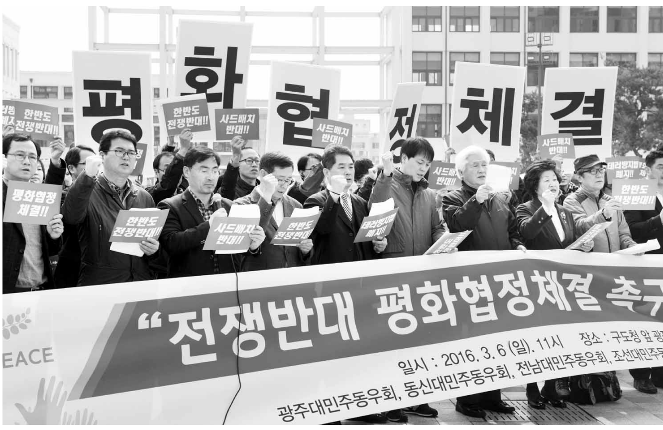
평화협정 체결 촉구 시위. 광주·전남지역대학 민주동우회협의회는 6일 광주시 동구 국립아시아문화전당 앞 5·18민주광장에서 기자회견을 열고 ‘한·미군사훈련 중단 및 평화협정 체결’, ‘사드(THAAD) 배치 반대’, ‘개성공단 중단 방침 철회’ 등을 촉구했다.

광주서부경찰은 6일 음주운전 단속 중인 경찰관을 부상 입힌 혐의(특수공무집행방해죄)로 중국인 A(42)씨에 대해 구속영장을 신청했다. 경찰에 따르면 A씨는 이날 새벽 0시40분께 광주시 서구 유덕요금소 앞 도로에서 음주운전 단속 중이던 B(37)경사가 자신의 레스토랑 승용차 안으로 팔을 넣어 시동을 끄고 내릴 것을 요구하자 B경사를 매달고 질주했다. 100m 가량 매달리던 B경사는 도로에 떨어져 머리와 온몸에 부상을 입었다. 경찰은 1시간 뒤 광산구 송정동 지인의 집 앞을 배회하던 A씨를 검거했으며, 체포 직후 A씨의 혈중알코올농도는 0.064%(운전면허 정지 수치)로 드러났다. A씨는 경찰 조사에서 “음주 운전과 불법 체류 사실이 적발될까 두려워 달아났다”고 진술했다. 한편 A씨는 지난 2011년 10월 판공피자로 입국했으며 같은 해 12월 체류기간이 만료됐다.