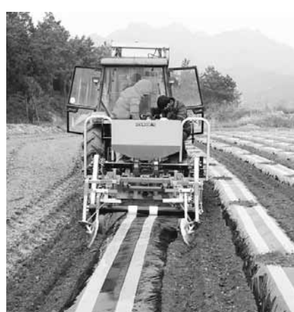
봄 감자를 파종하고 있는 일괄 파종기.