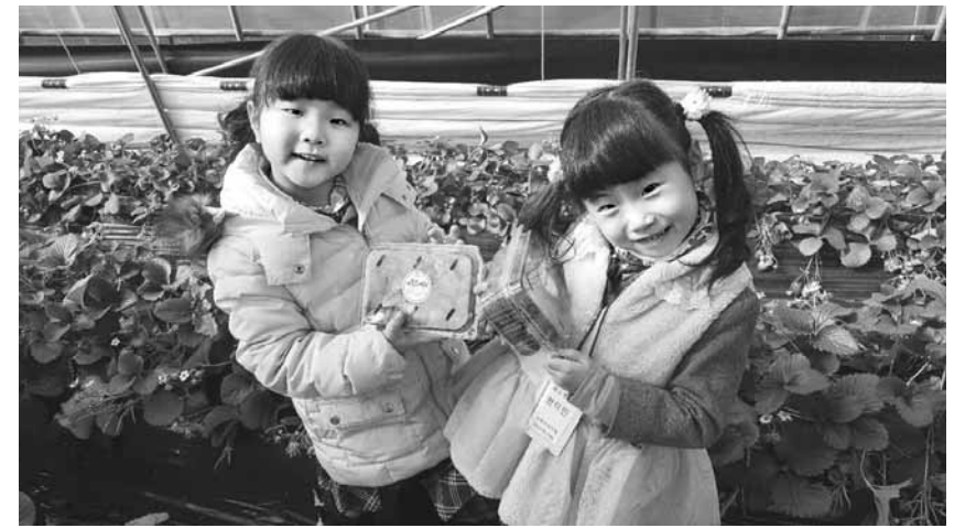
곡성군 대신주말농장에서 ‘딸기따기 체험행사’를 한 어린이들이 직접 수확한 딸기를 손에 들고 활짝 웃고 있다.

고흥군 관계자는 “태양관측은 태양필터 등 안전장비를 갖추지 않은 상태에서 관측할 경우는 부상 등의 위험이 있다”면서 “태양이 가려지는 면적이 작은 부분일식의 경우에도 반드시 안전장비 등이 포함된 전문 망원경을 통해 관측해야 한다”고 말했다. 한편 지난 2011년 2월 개관한 고흥우주천문과학관은 우리나라 최대급인 800mm 반사망원경과 200mm급 보조망원경 9대를 보유하고 있으며, 3D 돔 방식의 천체투영실과 각종 전시실, 체험시설이 마련돼 있다. /고흥=주각중기자 gju@