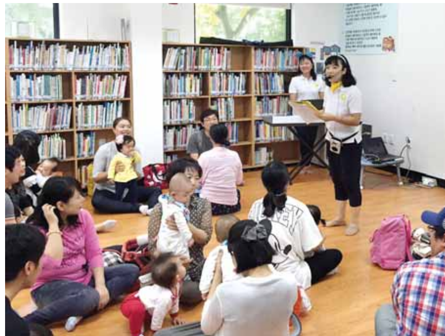
순천시 도서관에서 아기(6~18개월)와 부모를 대상으로 북스타트 프로그램을 운영해 큰 호응을 얻고 있다.

순천시 관계자는 8일 "북스타트 프로그램은 영·유아 심리와 발달특성에 맞는 책으로 구성돼 있어 아이는 물론 부모에게도 필요한 육아교육 기회를 제공할 것"이라며 "영유아를 키우는 부모들의 많은 참여를 바란다"고 말했다. /순천=박선천기자 psc@