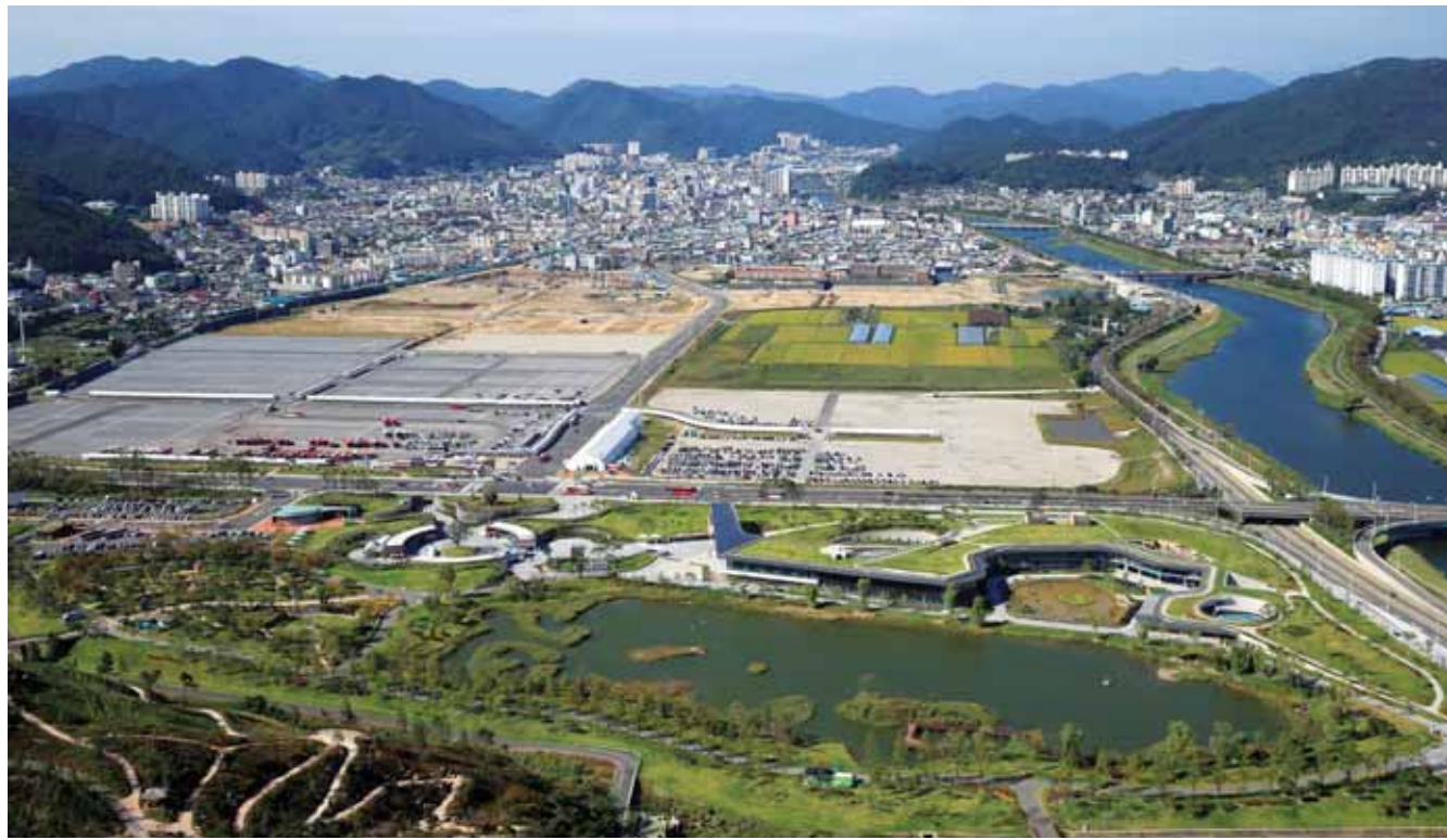
순천시는 도심 공동화 현상 등을 막기 위해 오는 2020년까지 외곽 도시개발을 중단하고, 내실을 튼튼히 하는 압축도시(콤팩트 시티) 정책을 펼친다. 사진은 순천시 전경.

순천시의 주택 보급률은 지난 2015년말 기준 107.9%로 2020년까지 계획 주택보급률이 108%에 근접할 것으로 보인다. 과도한 주택 공급으로 최근 주택가격이