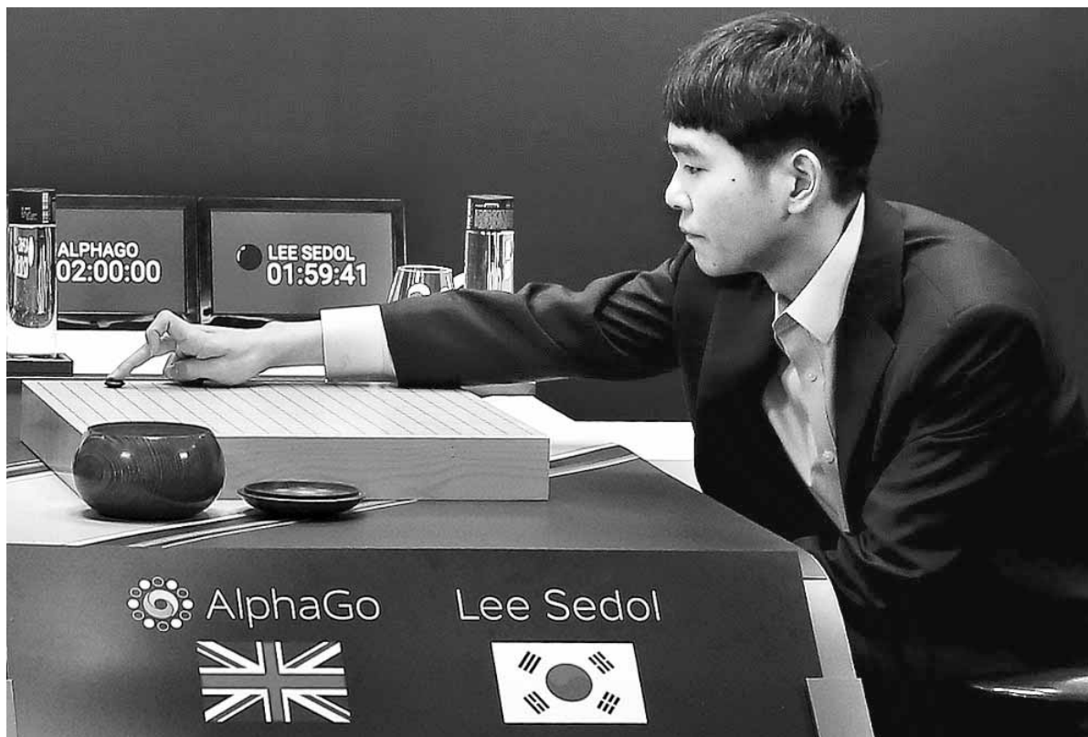
이세돌 9단이 9일 오후 서울 종로구 포시즌스 호텔에서 열린 '구글 딥마인드 챌린저 매치'에서 구글 딥마인드가 개발한 인공지능 프로그램 '알파고'와 대국을 시작하며 첫 수를 두고 있다.

인간과 기계가 맞붙은 세기의 두뇌 대결에서 기계가 기선을 제압했다. 인공지능(AI)의 최강자 알파고가 특별대국 5번기 제1국에서 이세돌에게 불계승을 거둬냈다. 이번 대국은 이미 연산능력에서 오래전 인간을 넘어선 뒤 진화를 거듭해온 인공지능의 발전 정도를 가늠할 수 있는 시금석이기도 했다. 바둑은 1997년 IBM사의 컴퓨터인 '딥블루'에 패한 서양장기 체스와 달리 경주의 수가 우주의 원자보다 많을 정도로 다양하고 복잡하다. 이 때문에 한국과 중국의 프로기사들은 대부분 이세돌의 입승을 예상했지만 빗나가고 말았다.