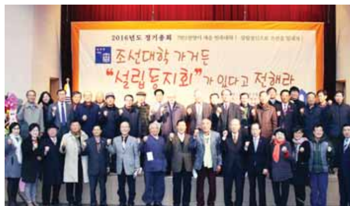
조선대학설립동지회는 지난 11일 조선대 서석홀에서 '2016년도 정기총회'를 열고 대학 설립과정과 설립정신 등 대토론회를 진행했다.