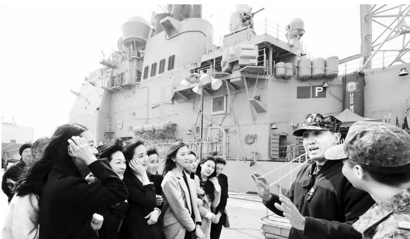
목포에 온 美 해군함정 ‘모빌 베이’ 14일 목포신항만에서 열린 미 해군 함정 ‘모빌 베이’(Mobile Bay) 순양함 일반 공개 행사에서 미 해군 장교가 광주여대 학생들에게 함정의 주요시설을 소개하고 있다.

전날 입항한 모빌 베이함은 18일~21일 한국 남방해역에서 해군 3함대 함정들과 함께 해상훈련을 한다.