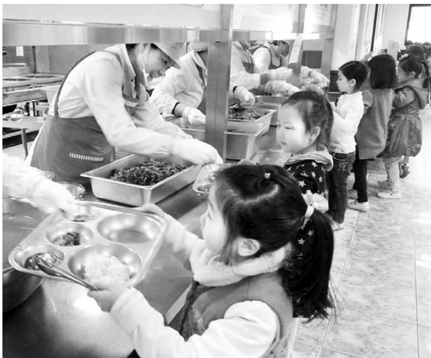
남원지역 초등학교생들이 지역 내 친환경 농산물로 만든 급식을 식판에 받고 있다.

남원시는 학교급식 식재료의 안정적인 공급과 가격 안정화를 위해 친환경농산물 학교급식 협의회를 통해 공급품목 및 단가를 결정하고 연 2회 이상 지도점검을 실시하는 등 품질 좋은 친환경농산물이 학교