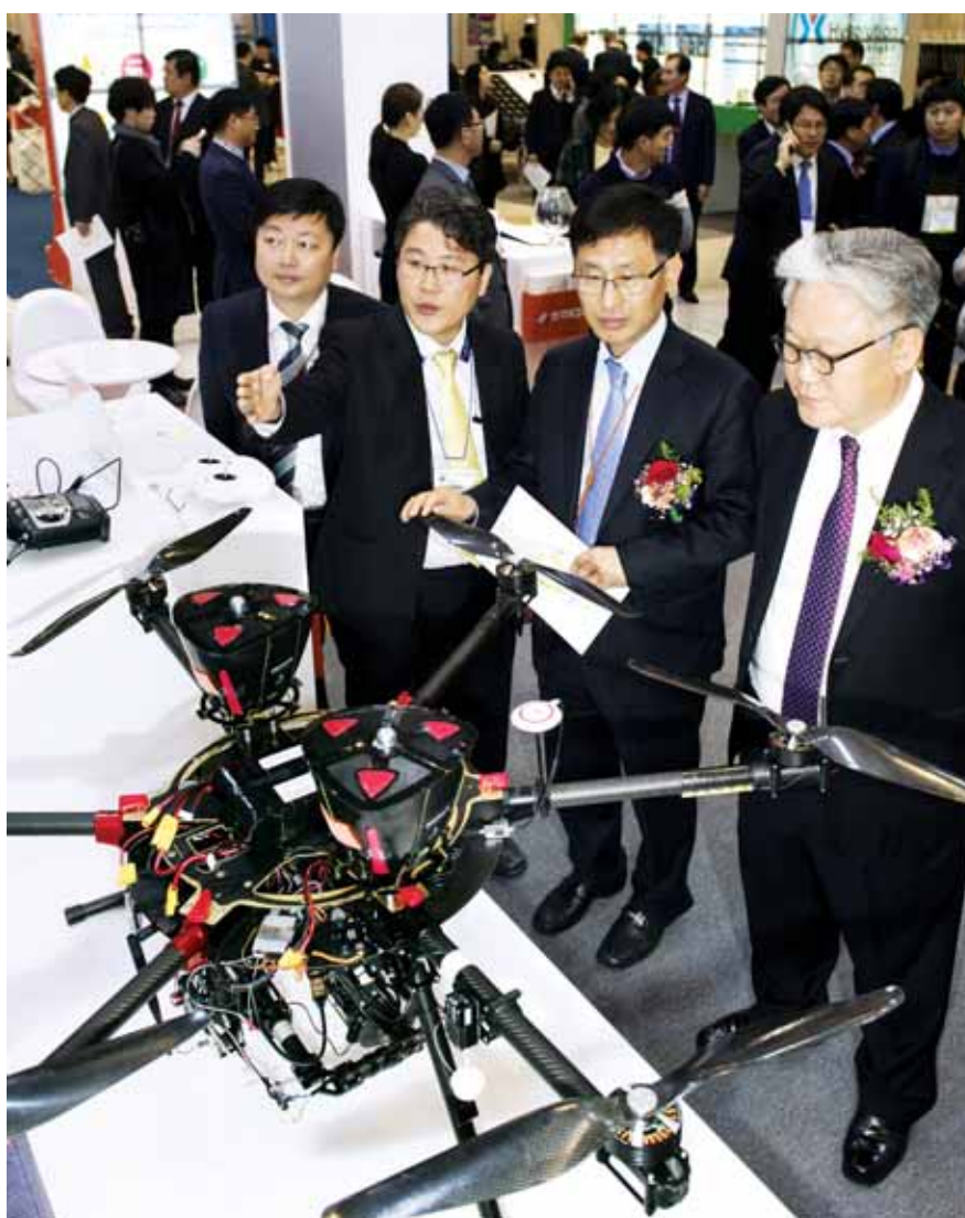
DJ센터 ‘국제신재생에너지 전문전시회’ 16일 김대중컨벤션센터에서 열린 국제신재생에너지 전문 전시회 ‘sweet2016(solar, wind & earth energy trade fair 2016)’를 찾은 참가자들이 전시장을 둘러보고 있다. 올해로 11회째 맞는 이번 전시회는 신재생에너지 저장기술과 효율적 사용'이란 주제로 전시관이 구성되고 에너지 효율 전문기업 47개사가 참가해 우수 에너지 기술을 한자리에서 볼 수 있다.