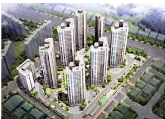
힐스테이트 각화는 대단지에 걸맞는 풍부한 생활인프라가 돋보인다. 홈플러스, 농산물유통단지 등의 대형마트와 풍부한 녹지공간을 갖춘 근린공원이 가까이 자

탄탄한 생활 인프라, 뛰어난 교육 환경, 편리한 교통 등 3박자를 갖춘 광주 ‘힐스테이크 각화’가 모델하우스를 열고 분양을 시작했다. 힐스테이크 각화는 광주시 북구 각화동 산30-5번지 일대에 들어선다. 740세대 아파트와 154세대 오피스텔의 대단지로 선보인 힐스테이트 각화는 지하 2층~지상 31층, 총 7개동 규모로 전용면적 59~84㎡의 중 소형 평형대로 구성됐다. 이번 분양에서는 총 740세대의 아파트 중 조합원세대 579세대를 제외한 161세대가 일반 분양을 통해 공급되며, 전용면적은 59㎡형 216세대 중 56세대, 79㎡형 260세대 중 24세대, 83㎡형 30세대 중 2세대, 84㎡형 234세대 중 79세대로 이루어진다.