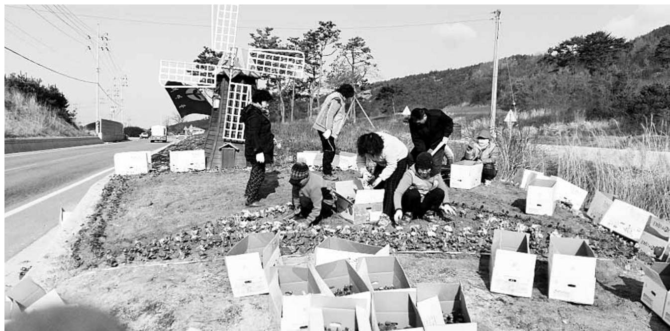
백수를 관광객맞이 봄꽃 심기 영광군 백수읍(음장 박성일)과 백수새마을부녀회는 최근 백수해안도로 내 화단에 데이지, 프리물러, 미니팬지, 금잔화 등 봄꽃 3300본을 색상별로 식재했다. /영광=이종윤기자 jylee@

한편 GK레저개발은 지난해 사업부지 매입을 완료했으며 현재 설계 및 인·허가를 추진하고 있다. /영광=이종윤기자 jylee@