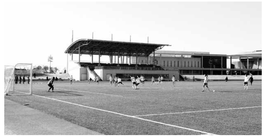
동계 전지훈련을 위해 무안을 방문한 축구선수들이 무안스포츠파크에서 연습경기를 하고 있다.