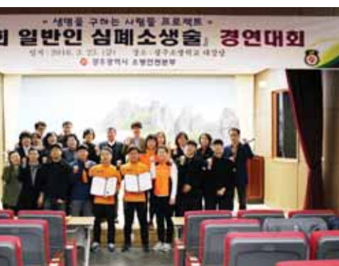
리는 전국대회에 광주대표로 참가한다.

우승한 롯데백화점팀은 오는 4월27일 대구 소방국제박람회에서 국민안전처 주관으로 열