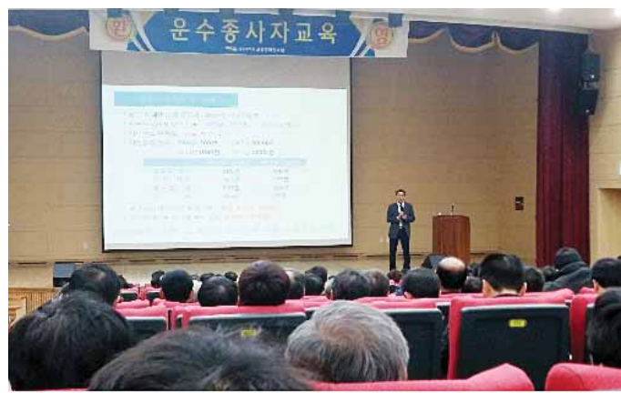
광주교통문화연수원(원장 정용식)은 최근 교통문화연수원 대강당에서 광주 시내버스 운전자를 대상으로 소문 중심의 운수종사자 교육을 실시했다.