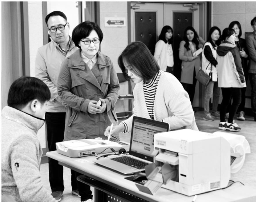
사전투표 모의체험 4·13 총선을 14일 앞둔 30일 광주시 광산구 우산동주민센터에서 열린 사전투표 모의체험행사에 참가한 시민들이 사전투표 모의 체험을 하고 있다. 사전투표는 다음달 8일·9일 2일간 실시된다.