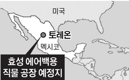
효성 에어백용 직물 공장 예정지

효성은 이미 멕시코 엔세나다 지역에 연간 생산량 900만 개 규모의 에어백 쿠션