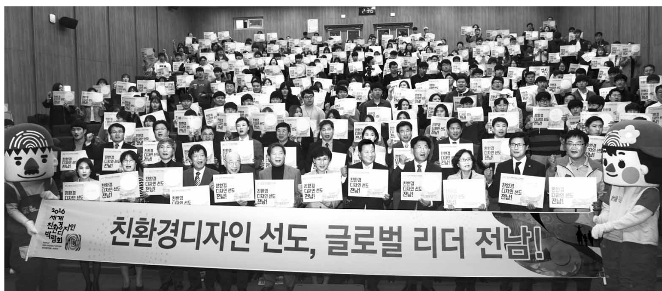
4일 나주시 혁신도시 농식품공무원 교육원 대강당에서 열린 한국친환경디자인 협의회 창립총회에서 참석자들이 창립선언문 낭독 뒤 기념촬영을 하고 있다.