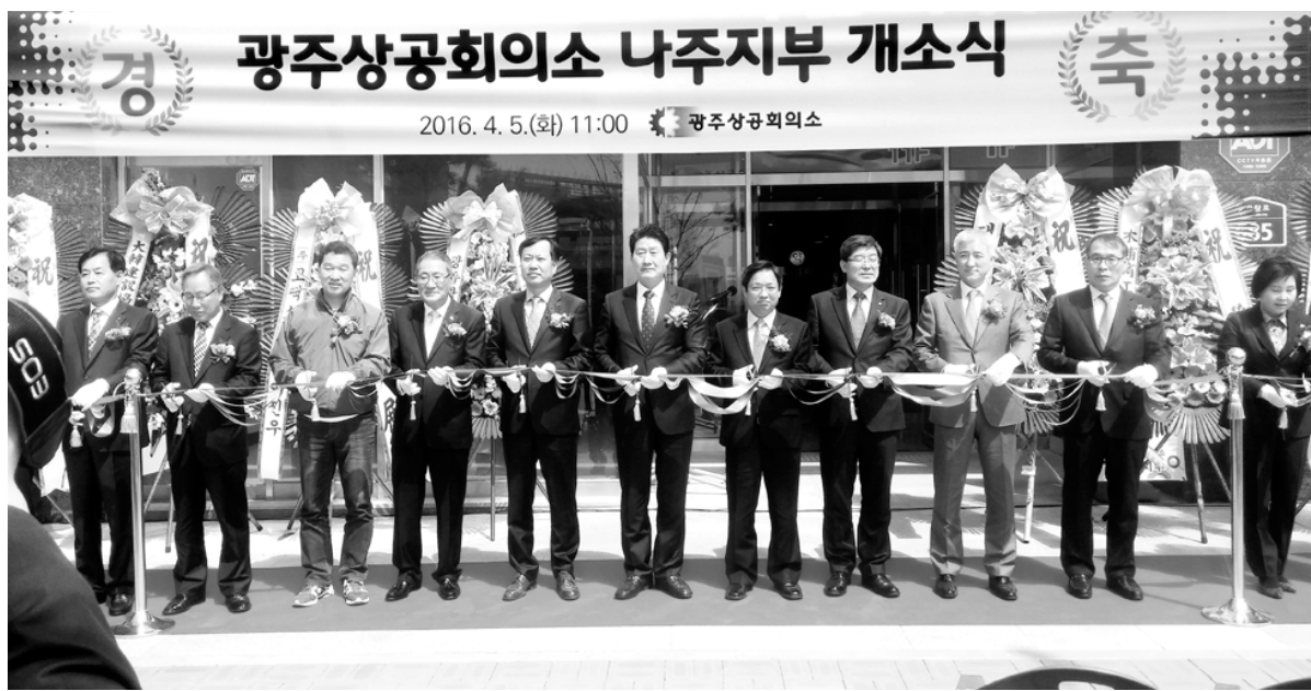
5일 나주시 빛가람로 일원에서 열린 광주상의 나주시부 개소식에서 참석자들이 테이프 커팅을 하고 있다.