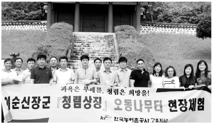
한국농어촌공사 고흥지사 임직원들이 지난해 고흥군 도화면에 있는 '이충무공 청렴상 징 오동 나무터'를 방문해 부패 척결을 다짐하고 있는 모습.

고흥지사는 그동안 자체 윤리위원회를 구성하는 등 반부패 활동을 체계적으로 운영하고, 신입사원들을 대상으로 윤리의식을 높이기 위한 윤리후견인 제도를 통해 부패없는 청렴한 공직자상을 구현하는 데 집중한 점이 높은 평가를 받았다. 또 모든 직원이 윤리 Cyber교육 2과목