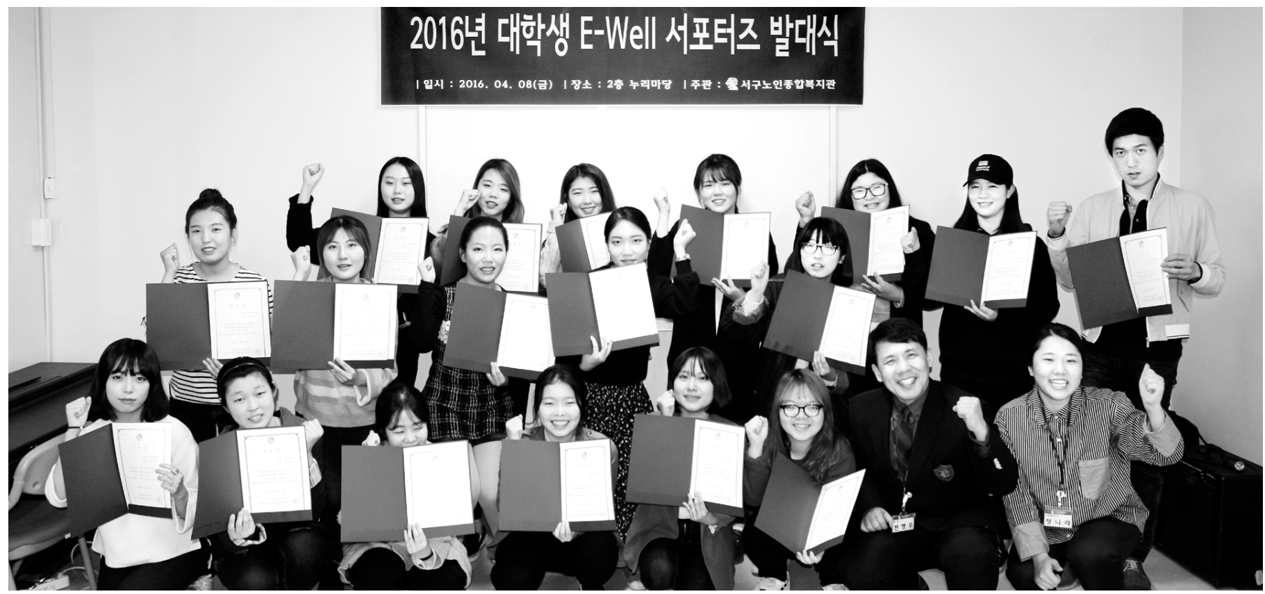
광주서구노인종합복지관 '대학생 E-Well 서포터즈' 20여명이 최근 복지관 본관 2층 누리마당에서 발대식을 가졌다.