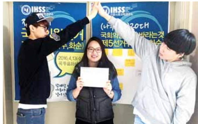
호남대학교 인문사회과학연구소(소장 심연수) '대학생 SNS 서포터즈단'은 제20대 국회의원 선거를 맞아 전남 10개 선거구를 방문해 투표독려 캠페인을 벌였다.