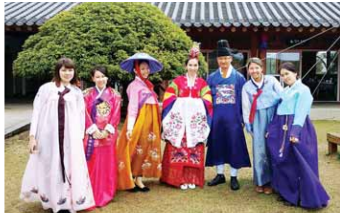
목포대학교(총장 최일) 국제교류교육원은 최근 카자흐스탄 국립농업대학 재학생을 대상으로 '2016년 1차 한국어문화연수'를 진행했다.