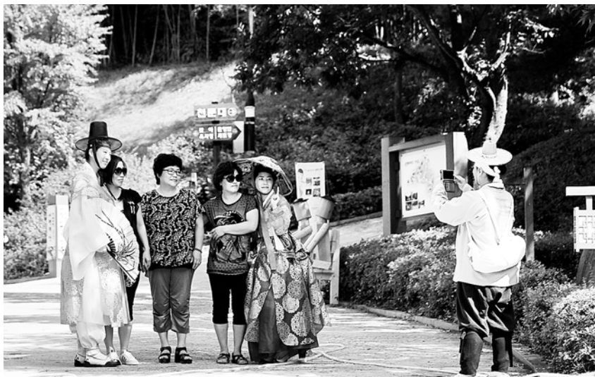
남원시의 대표 관광지인 춘향테마파크를 찾은 방문객들이 전통복장 길벗 도우미들과 기념촬영을 하고 있다.

오르막 경사로를 오르는 지저움을 해소하고 추억에 남는 사진촬영에 도움을 주기 위한 전통복장 길벗도우미를 매주 화~목요일 오전 10시부터 16시까지 운영한다. 국궁체험을 할 수 있는 과녁을 설치하고 전문지도사번으로부터 국궁 예절, 활쏘기를 배우고 체험할 수 있도록 했다.