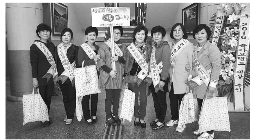
고창군 경제살리기고창본부 여성회원들은 최근 고창지역 관공서 등을 돌며 ‘내 고장 상품 애용하기 운동’을 펼쳤다.