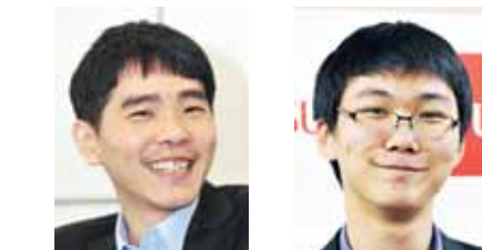
이세돌 9단 박정환 9단

이세돌 9단은 이 대회에 임하는 각오가 남다르다. 그는 알파고와 대국을 마친 후 인터뷰에서 “응씨배 우승을 꼭 이루고 싶다”고 밝힌 바 있다. 통산 18번 세계대회 우승을 차지한 이세돌 9단이 아직 정복하지 못한 대회가 바로 응씨배다. 대회는 19일 개막식과 조 추첨식을 시작으로