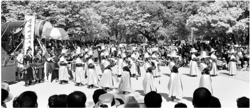
특히 남원시는 올해 남원관광객 500만 시대를 목표로 하고, 전국 대도시 다중집합소플레시즘 홍보활동과 타 지역 초청공연, 코레일 투어단 대상 홍보활동 등을 추진하며 국내·외 관광객 몰이에 나설 계획이다. /남원=정규성기자 jgs@

화려한 봄꽃들과 함께 새 모습으로 단장한 남원 '신관사또부임행사' 상설공연이 오는 10월말까지 매주 주말 운영된다. 고전 춘향전을 푸른 공연물로 개발한 신관사또부임행사는 남원시민 80여명이 직접 참여하고 있으며, 남원의 무형자원을 재해석한 탁월한 기획과 화려한 퍼레이드 행렬로 푸른 마당극을 선보이며 관광객의 사랑을 받고 있다. 창단 10주년을 맞이한 신관사또부임행차 공연단은 올해를 제2의 도약의 해로 정하고, 새롭고 다양한 공연을 선보이기 위해 개인 역량강화와 관광마인드 교육 등 3개월간의 교육과정을 실시하기도 했다.