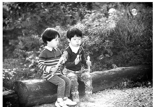
안상진 작 ‘어릴적 친구’