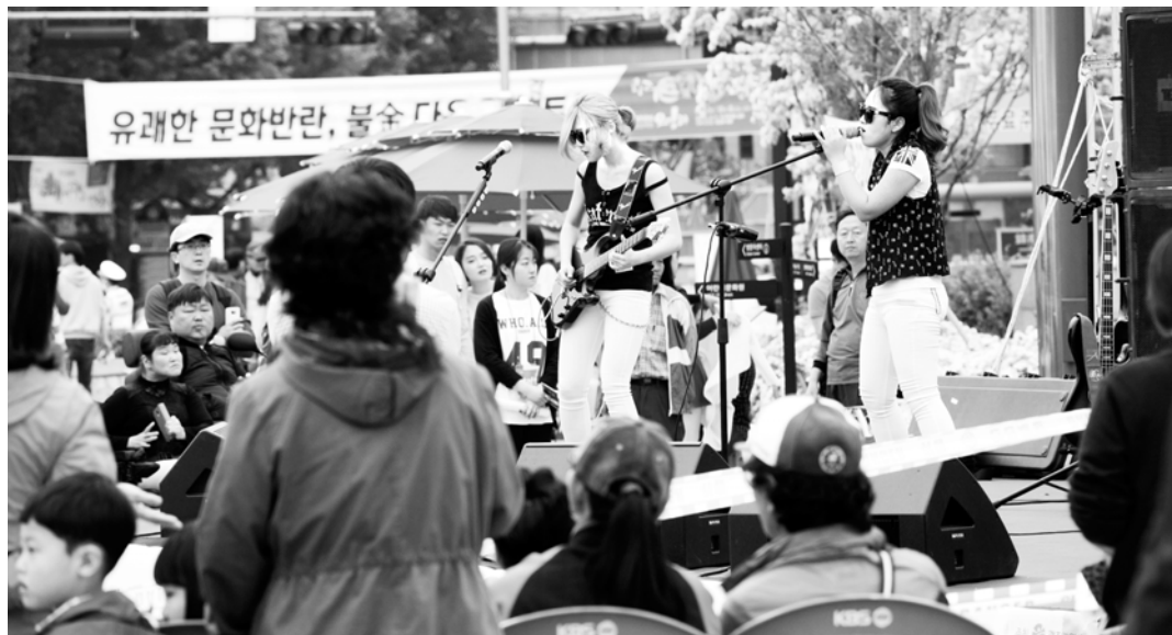
Mnet ‘슈퍼스타K’에 출연하며 이름을 알린 함평 출신 ‘여우별밴드’ 공연 모습.

‘프린지 페스티벌’은 매일 둘째주 토요일(오후 2시~7시)에는 5·18민주 광장에서, 넷째주 토요일