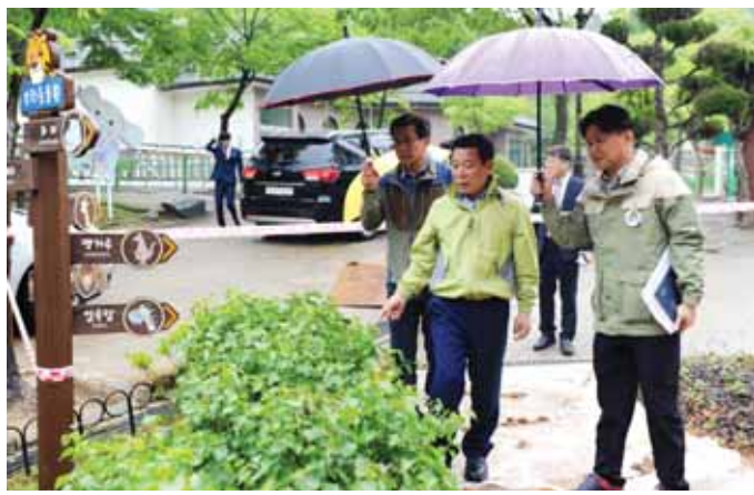
윤장현 광주시장이 어린이 날 연휴를 앞둔 2일 오후 우치공원을 찾아 각종 편의시설과 안전 시설물을 점검하고 있다.