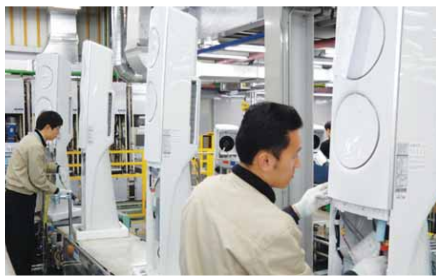
삼성전자 광주사업장 무풍에어컨 'Q9500' 생산라인에서 근로자들이 작업에 열중하고 있다.

Q9500은 전 세계 최초로 바람 없이도 실내 온도를 균일하게 유지해 주는 '무풍냉방' 기술을 적용한 에어컨이다. 이 제품은 삼성전자가 전 세계 최초로 포물선 회오리 바람으로 소비자가 원하는 쾌적 온도까지 빠르게 도달한 후, 에어컨 전면의 '메탈쿨링 패널'에 적용된 '마이크로 홀'을 통한 '무풍냉방'으로 실내 온도를 시원