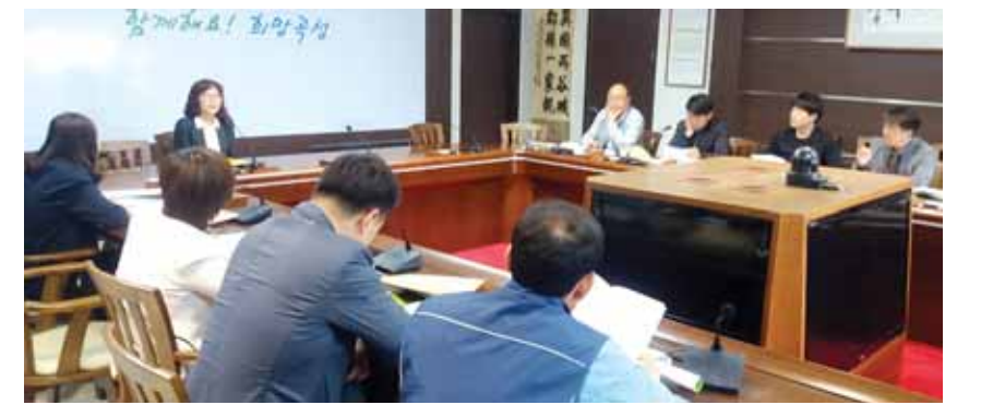
광주지방국세청은 지난달 19일 곡성군청에서 곡성군청 근로장래금 읍·면 현직신청창구 담당자 대상으로 현장 설명회를 가졌다.