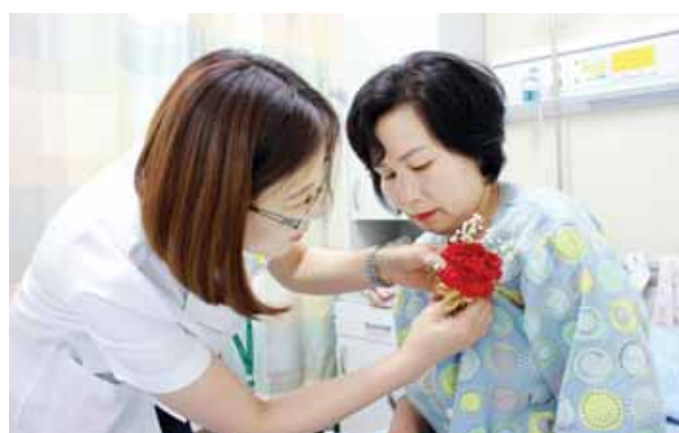
선한요양병원은 최근 어버이날을 맞아 병원에 입원중인 어르신들 가슴에 카네이션을 달아드리는 감사의 행사를 진행했다.