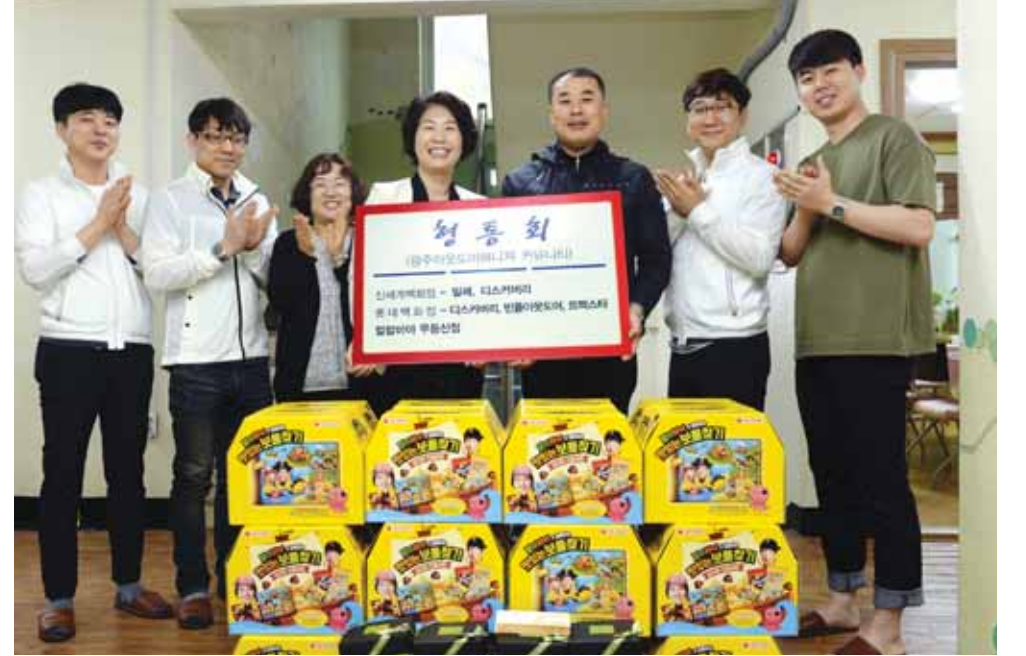
이웃도어 매장을 하면서 인연을 맺어온 젊은이들의 모임 '형통회' 회원들이 지난 3일 광주시 동구 남동 아동보호시설 성빈여사에 200만원 상당의 상품과 문화상품권을 전달했다.

또 매장 수익금 일부를 병원에 기부하고 광주일보에서 발행하는 문화·예술 전문잡지 '예향' 구독권을 사회·복지단체에 기증하는 등 나