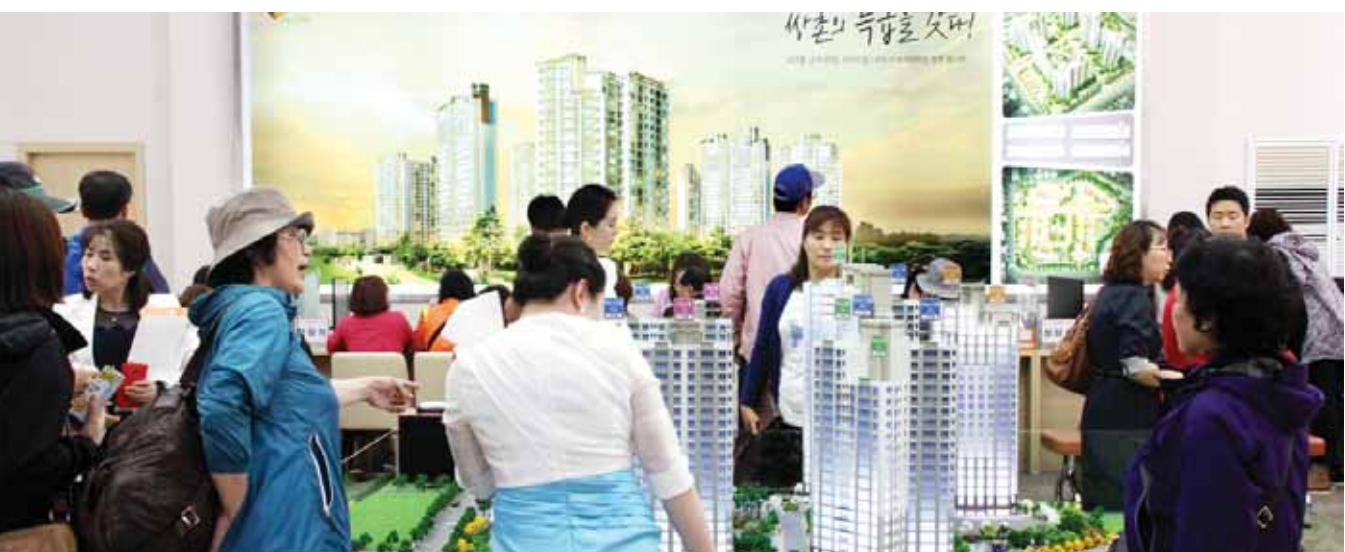
6일 광주시 서구 금화로 15(금호동)에 개관한 쌍촌 엘리제 모델하우스에 첫날 3000여명이 방문하는 등 성황을 이뤘다.

작년을 제외하고 예년과 비교하면 올해 4월 주택담보대출 증가액은 2010년 이후 최대 규모다.