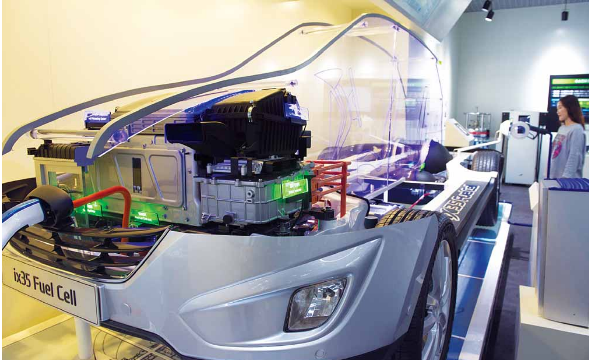
현대차그룹의 협업으로 문을 연 광주창조경제혁신센터는 자동차 산업 발전과 미래 친환경차로 자리매김할 수소연료전지차 산업 생태계 조성을 목표로 광주시가 추진하는 자동차 100만대 생산도시 육성과 지역경제 발전이라는 핵심 과제를 지원하는 최적화된 기관이다. 광주혁신센터에 전시되어 있는 현대차 투싼 ix35 Fuel Cell(수소전지차) 엔진 모형.