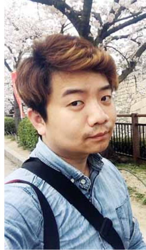
김 대표의 “조만간 독자가 4만명을 넘어설 것 같다”며 “이제 페이스북을 넘어 또 다른 플랫폼에서도 ‘아마 광주랑개?’ 콘텐츠를 접할 수 있는 환경을 구축하고 있다”고 설명했다. 그가 염두에 둔 환경은 젊은층 유입률이 높은 ‘인스타그램’과 보다 자세한 정보와 많은 양의 정보를 올릴 수 있는 ‘블로그’ 등이다. “주 독자층인 20대가 필요한, 원하는 정보를 누구보다 잘 알고 있는 게 같은 20대죠. 이들을 대신해 직접 발로 뛰어서 정확한 정보를 제공하고, 지역발전에도 도움을 주는 콘텐츠 개발을 고민하겠습니다.” /박기웅기자 pboxer@

들이 활동이 늘면 ‘아마 광주랑개?’ 콘텐츠도 늘어 ‘일석이조’다. ‘아마 광주랑개?’ 운영진들은 ‘페친’들을 ‘독자’라고 부른다. 단순한 커뮤니티 성격을 벗어나 신뢰할 수 있는 다양한 정보를 전달하는 ‘미