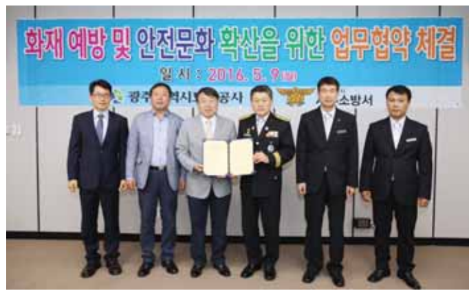
광주도시공사(사장 조용준)는 9일 광주 서부소방서(서장 장용주)와 업무협약을 체결, 화재예방 및 안전문화 확산을 위해 노력하기로 했다.