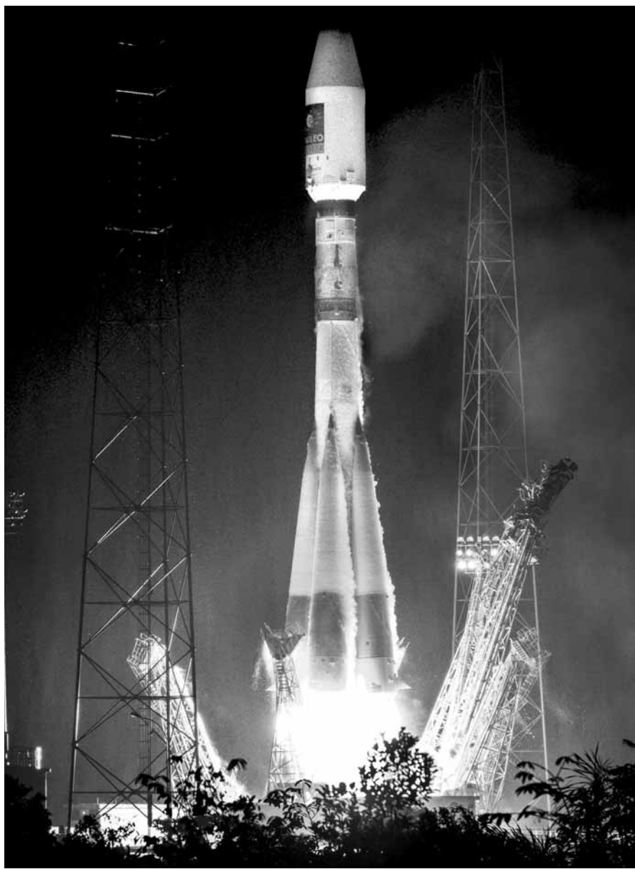
프랑스 '갈릴레오' 위성 발사 프랑스 국립우주연구원(CNES)은 최근 '갈릴레오' 위성 항법 시스템에 쓰일 위성 두 개를 실은 소유스 로켓을 발사했다. 갈릴레오 시스템은 위성 항법 시장을 독점하고 있는 미국의 GPS에 대항하기 위해 유럽연합(EU)과 유럽우주국(ESA)이 추진한 프로젝트다. 이로써 총 위성 14기를 확보하게 돼 경쟁력을 높일 수 있을 것으로 기대된다.

지구와 화성은 평균 1억4000만 마일(2억2500만km) 떨어져 있으며, 최근 가장 가깝게 만난 것은 4300만 마일(6920km)을 사이에 뒀던 2005년이였다.