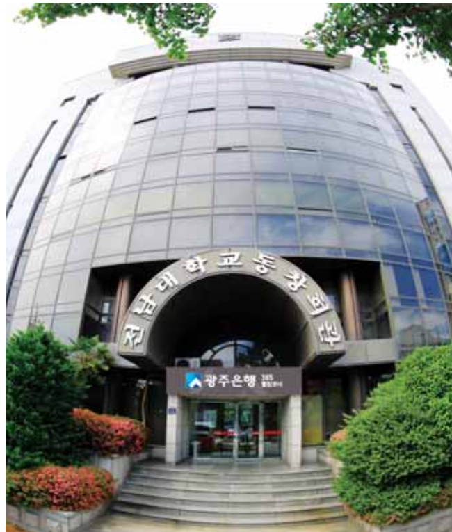
전남대 총동창회회관 전경.

총동창회는 지난 1956년 7월 8일 1·2회 졸업생들이 모여 국립대 중 처음으로 창립한 뒤 60년 동안 전국 및 세계 각지에 33만 동문들의 구심점 역할을 해왔다. 총동창회는 호남의 중심거점대학 뿐 아니라 '세계 100대 대학'으로 성장하는 데 큰 역할을 했고 동문들은 군사 독재 정권에 맞선 반독재 투쟁과 5·18 광주항쟁을 통해 전남대가 민주·인권의 대학으로 자리매김하는데도 공헌했다. 동창회는 아울러 약 100억 원의 발전기금을 모아 모교에 기부하는가 하면, 지난 1992년 세워진 장학재단을 통해 올해까지 589명에게 장학금(7억여원)을 지급, 후배들이 지역은 물론 국가에 보탬이 되는 인재로 커 나갈 수 있도록 뒷받침해왔다. 그동안 국내외 각계에 골고루 진출, 활발한 활동을 펼치고 있는 동문들도 적지 않다. 정시제(법대·전 농림수산부장관, 허상만(농생대·전 농림부장관), 이용섭(경연대·전 행정부장관, 전 건설부장관 등) 동문 등은 장관을 지내며 학교를 빛냈고 학부 출신으로 국회의원을 지낸 동문도 26명에 이른다. 또 배만은 전 대법관(법대), 김양균 전 헌법재판관(법대), 박재승(법대) 전 대한변호사협회장을 비롯, 지금까지 370여명이 사법고시를 거쳐 법조계에 진출했고 법학전문 대학원을 거쳐간 변호사도 400여명에 달한다.