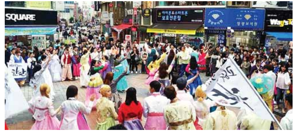
지난 4일 광주지역 청년들이 직접 기획한 광주한복데이 ‘한!판!’ 행사가 지난 4일 광주시 동구 총장로 일대에서 열렸다.

저마다 바쁜 일정에 모이는 것조차 쉽지 않았지만 두 달간 매주 기획회의를 거쳐 순수 청