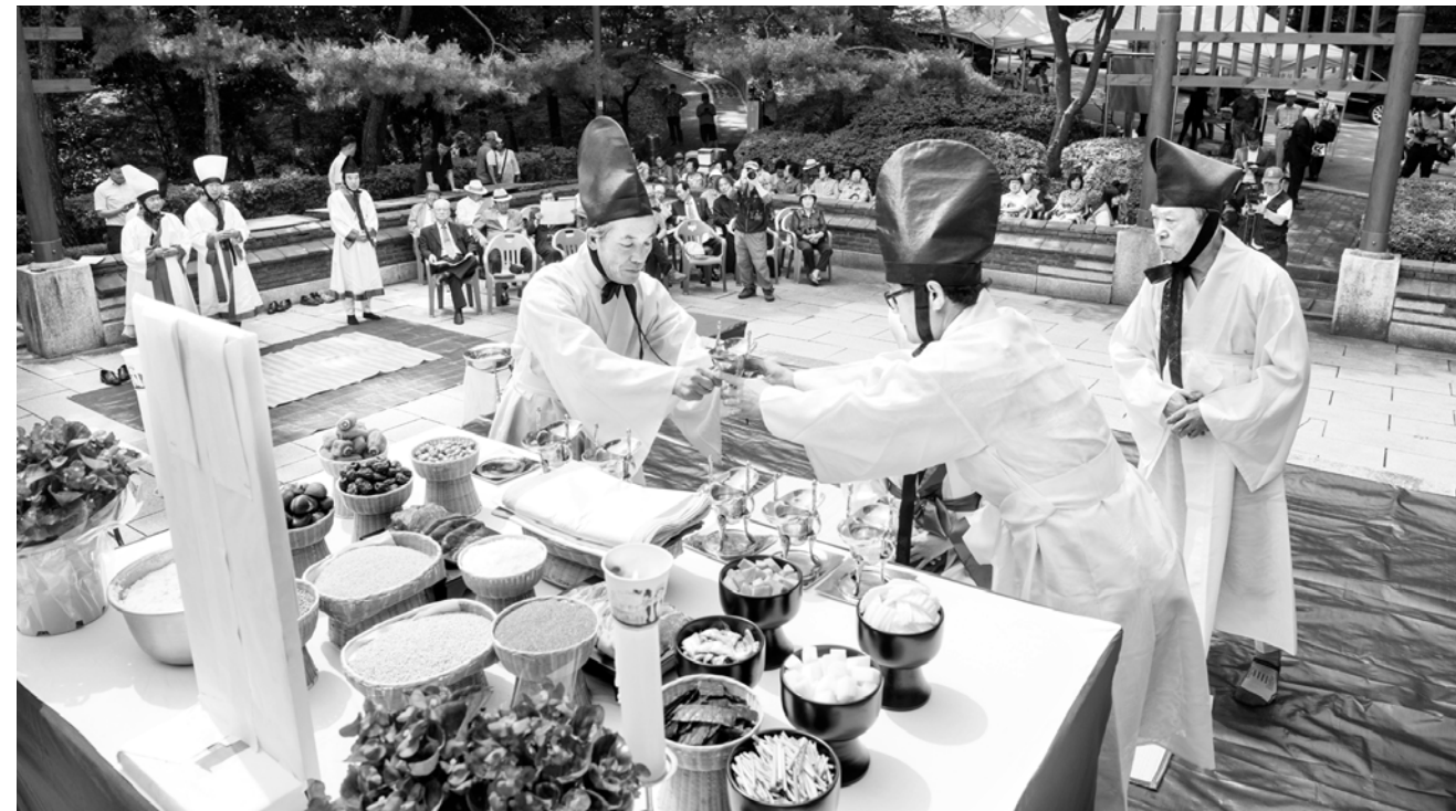
“나라엔 평안 들인 풍년” 단기 4349년 사직대제가 9일 오전 광주 남구 사직공원 내 사직단에서 광주사직대제행사추진위원회 등이 참석한 가운데 열렸다. 사직대제는 땅을 관장하는 사신(社神)과 농사의 풍년을 좌우하는 곡식의 신인 직신(稷神)에게 나라가 태평하고 백성이 평안하기를 기원하는 전통 제례의식이다.