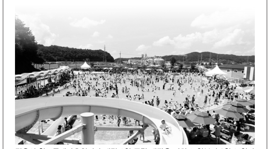
정읍시 칠보물놀이장(유원지)이 내달 2일 주말 개장을 거쳐 15일부터 8월 21일까지 운영된다.

도색과 탑승계단, 그늘막 설치 등 시설을 추가로 보완했다. 이와 함께 운영기간 깨끗한 수질관리를 위해 여과 및 소독시설을 갖춘 것은 물론 매일 시설을 청소하고 물을 교체하는 등 청결유지에도 만전을 기하기로 했다. 입장요금은 정읍시민은 어린이 2000원, 청소년 3000원, 성인 4000원이며, 정읍시 외 거주자는 어린이 4000원, 청소년 5000원, 성인 6000원이다. 20명 이상 단체 입장은 거주지 관계없이 요금의 20%를 할인 받을 수 있다. 정읍시 거주 여부는 입장권 구입시 주민등록증 등 신분증을 보여주면 된다. 정읍=박기섭기자 parks@