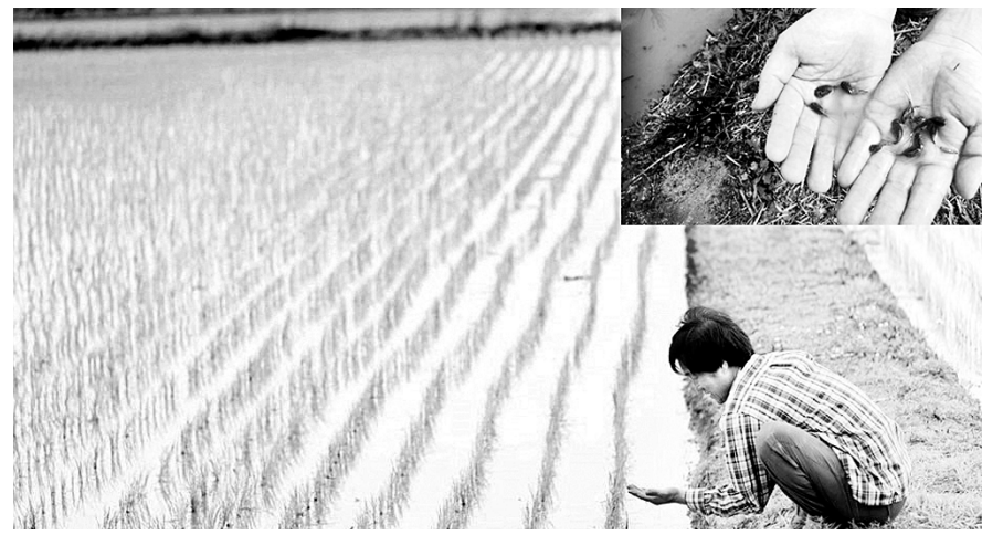
정읍시 고부면에서 친환경 농업을 하고 있는 한 농민이 ‘살아 있는 화석’으로 불리는 긴꼬리투구새우를 잡고 있다.

정읍시 고부면 신중리의 친환경농업단지에 ‘살아있는 화석’으로 일컫는 긴꼬리투구새우가 대량 서식하는 것으로 확인됐다. 정읍시는 “농약과 비료의 무분별한 사용으로 논에서 자취를 감췄던 긴꼬리투구새우가 ‘논제 친환경농업 1·2단지’의 전체는 31.4ha 가운데 3.3ha에서 대량 서식하고 있음을 확인했다”고 28일 밝혔다. 지난 2002년부터 친환경농업을 시작한 이곳은 2005년부터 긴꼬리투구새우가 되돌아오기 시작해 지금은 서식처가 크게 확대되고 있다. 긴꼬리투구새우는 고생대 화석에서도 발견돼 ‘살아있는 화석’으로 불리며, 환경부 지정 멸종위기 2급으로 환경 영향평가 지표 생물이다. 머리에 동그런 투구를 쓴 것처럼 보이고 꼬리는 가늘게 두 갈래로 뻗