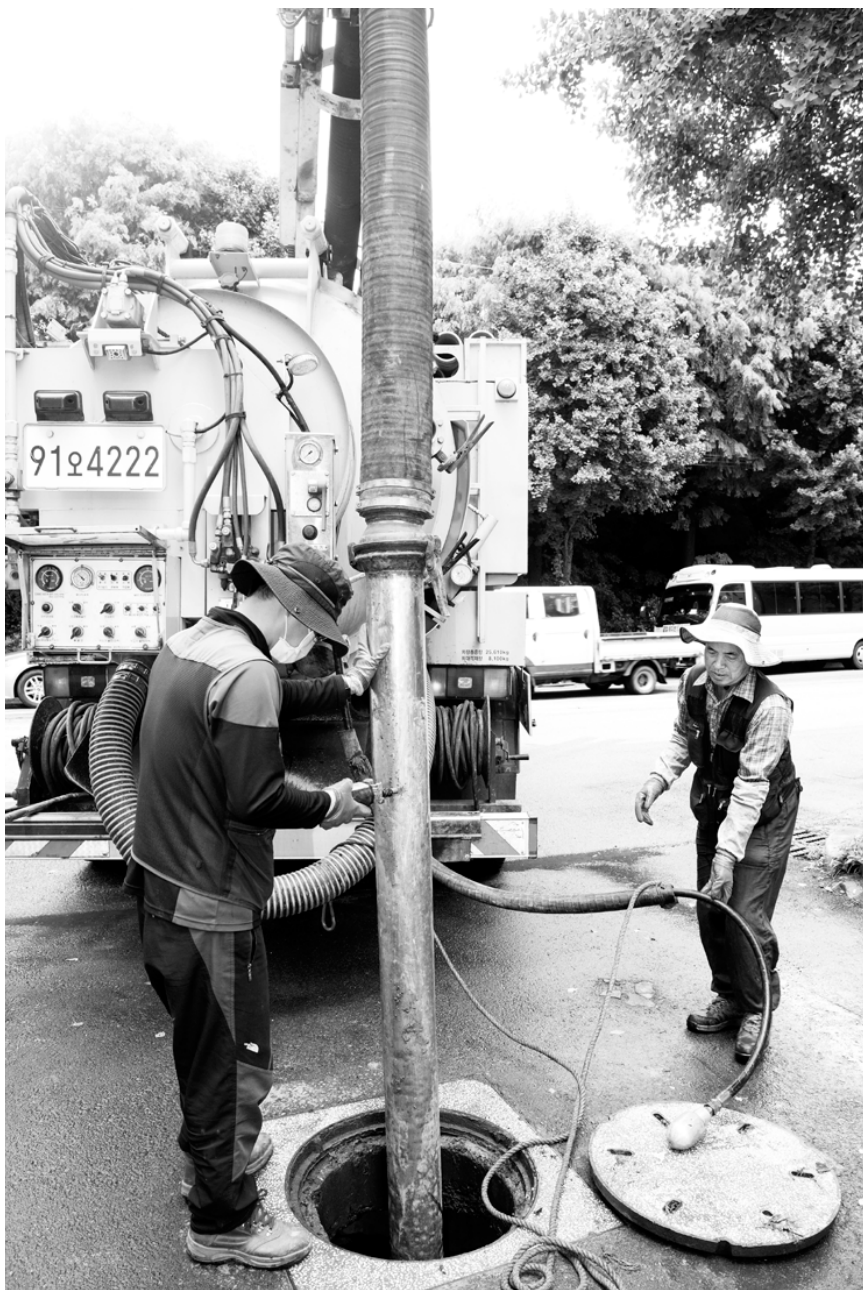
장마철 하수구 청소 광주 북구청 건설과 직원들이 4일 용봉동 주택가 이면도로에서 폭우에 대비, 하수준설차를 이용해 하수관로에 쌓인 모래 등 침전물 제거 작업을 하고 있다.