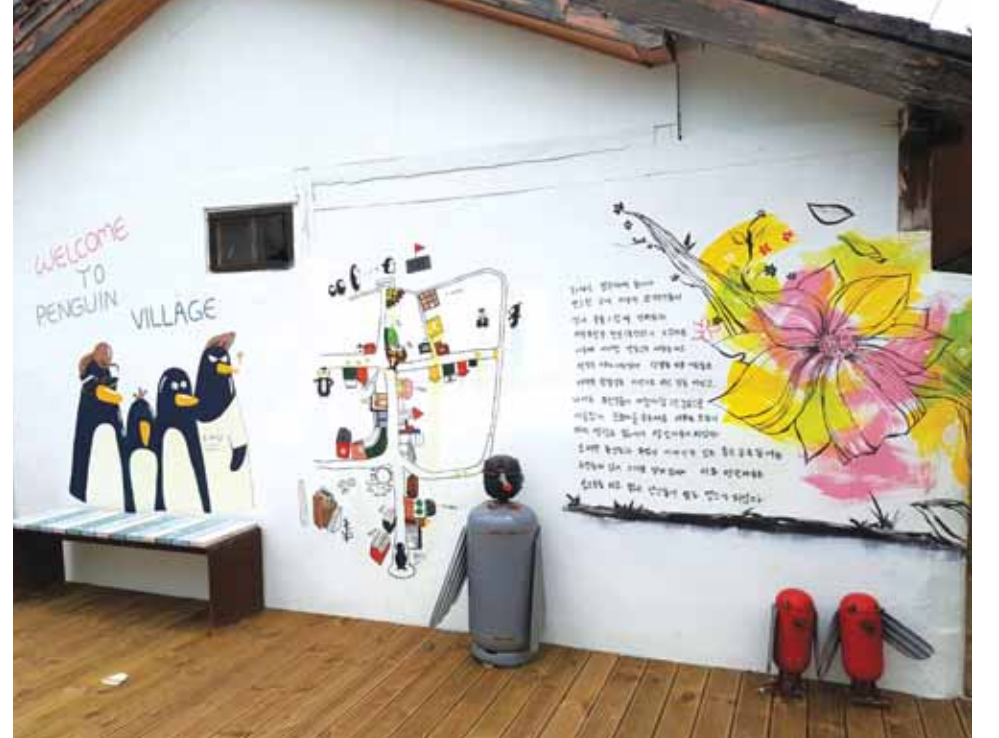
‘2017 올해 관광도시’로 선정된 광주시 남구는 양림동을 거점으로 투어 프로그램 등 다양한 행사를 진행한다. 많은 이들의 발걸음이 이어지고 있는 ‘펭귄마을’.

한편 관광청 서포터즈도 모집한다. 체험·투어 안내, 사무 지원, 영상 기록, 통역, 부스 운영 등의 업무를 맡게된다. 마감은 오는 26일이다. 참여인원이 적은 관계로 모든 프로그램 예약 필수. 홈페이지(www.visityangnim.kr)와 페이스북(www.facebook.com/visityangnim) 문의 062-607-2327. /김미은기자 mekim@kwangju.co.kr