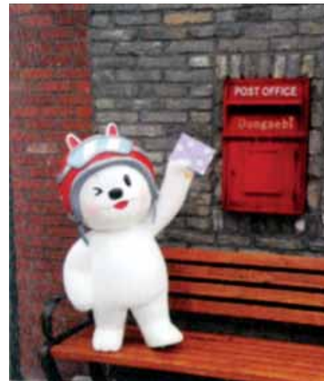
이야기 배달부 동개비