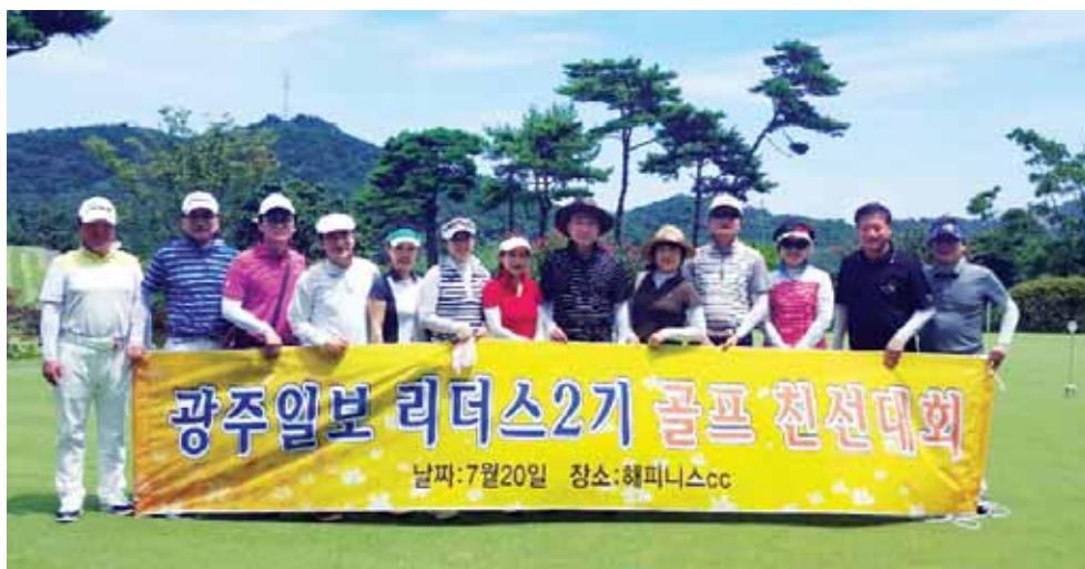
광주일보 리더스아카데미 2기 원우회 친선골프대회가 20일 나주 해피니스CC에서 원우 등 20여명이 참석한 가운데 열렸다.