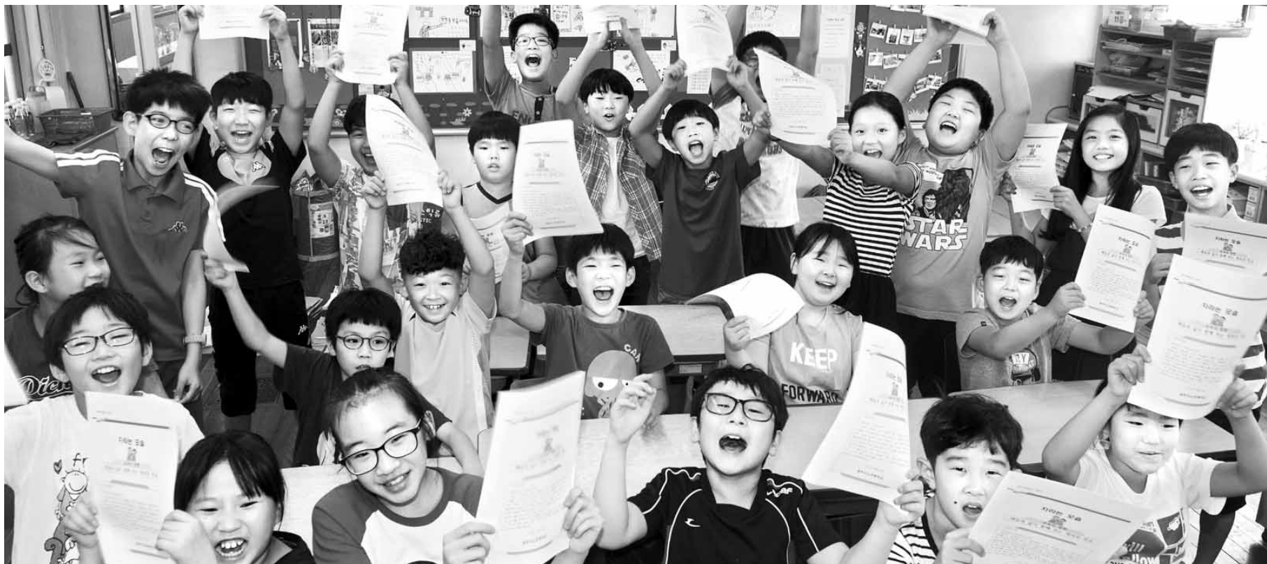
“방학이다” 광주·전남 초등학교가 속속 방학에 들어가고 있다. 광주에서는 21일 자산초교를 시작으로, 22일 48개, 26일 37개 초교가 잇따라 방학에 들어간다. 전남에서도 지난 15일부터 금당초교 등이 방학식을 가졌다. 교실에서 방학식을 마친 뒤 즐거워하고 있는 자산초교 학생들.