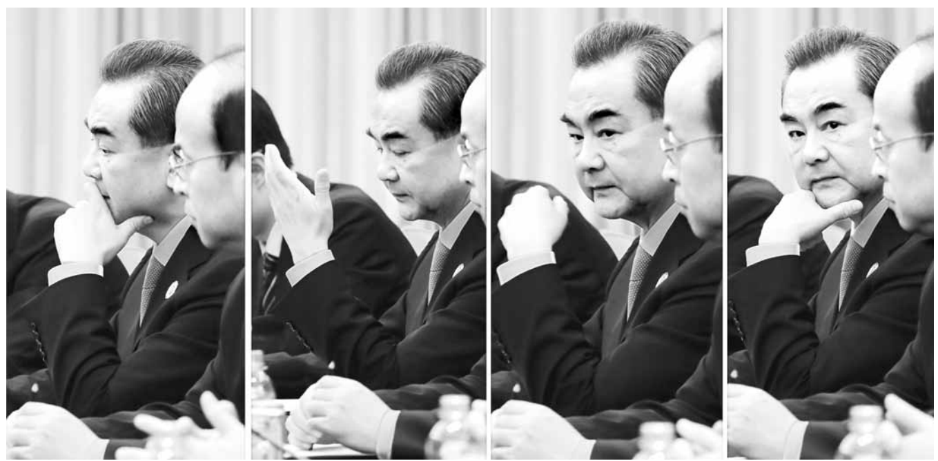
중국 왕이 외교부장이 25일 오전(한국시간) 라오스 비엔티안 돈찬팰리스호텔에서 열린 중국과의 양자회담에서 윤병세 외교장관의 발언을 듣던 중 불만이 있는 듯 손사래를 치고 있다.

예비군 훈련 신청·연기 때 휴대폰 인증도 허용하기로 했다. '1인 1차량' 냉동차량 화물운송업자는 별도 사무소가 필요하지 않지만 사무소를 영입신고 요건으로 요구한 규제를 고쳐 영입자의 주소지를 사무소로 보고 허가해주기로 했다.