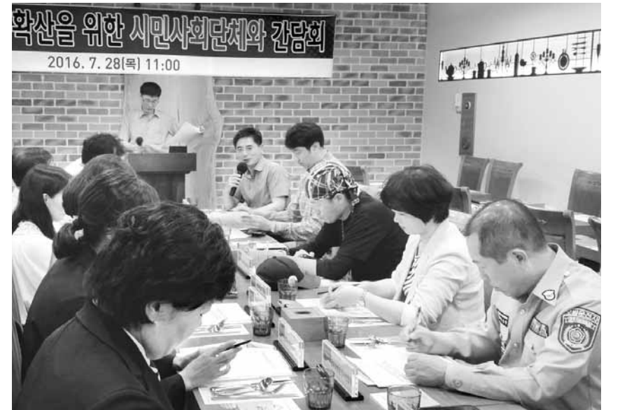
배려하는 교통문화 만들기 광주시는 28일 김대중컨벤션센터 내 멀리하우스에서 14개 지역 시민단체 대표와 배려교통문화 확산을 위한 간담회를 열고 실천방안에 대해 의견을 나눴다.