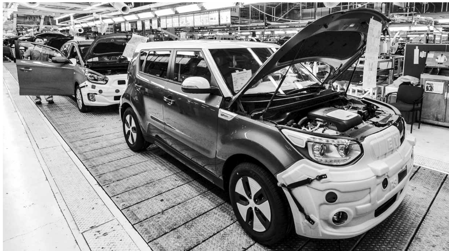
쏘울과 쏘렌토를 생산하는 기아차 광주1공장 생산라인에서 직원들이 완성차 조립작업에 열중하고 있다.

현대기아차가 세계 주요 완성차 업체 가운데 자국 생산비율이 가장 높은 것으로 나타났다. 지난 31일 한국자동차산업협회와 일본 자동차 연구기관인 포인(FOURIN)에 따르면 현대기아차는 2015년 한 해 동안 생산한 798만8479대 중 44.8%인 355만6862대를 국내 공장에서 만들었다. 이같은 자국 생산비율은 글로벌 톱5 완성차 업체 중 가장 높고, 5개사 평균인 30.7%를 크게 웃도는 것이다. 현대기아차에 이어 두 번째로 자국 생산비율이 높은 업체는 토요타로, 지난해 생산한 128만8122