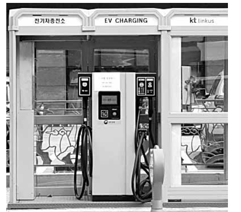
서울시 금천구 가산동에 위치한 공중전화부스 전기차 충전소. 연녹색을 띠고 있어 쉽게 발견할 수 있고 친환경 이미지도 함께 줄 수 있다.

에 비해 2015년에 자국 생산비율이 하락했다. 토요타는 40.1%에서 39.2%, 닛산은 18.9%에서 18.7%, 혼다는 21.4%에서 16.1%, 스즈키는 34.9%에서 30.8%, 마쓰다는 66.8%에서 61.6%로 각각 줄어든 것이다. 반면에 현대기아차는 2014년 44.8%에 이어 2015년에도 같은 비율을 유지했다. /김대성기자 bigkim@kwangju.co.kr