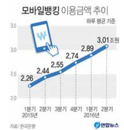
이제는 모바일뱅킹이 조회 서비스와 소액지급 이체 중심으로 이용되고 있기 때문이라고 한은은 설명했다.

전체 인터넷뱅킹에서 모바일뱅킹이 차지하는 비중은 건수 기준 61.3%, 금액 기준 7.3%로 큰 편차를 보였다.