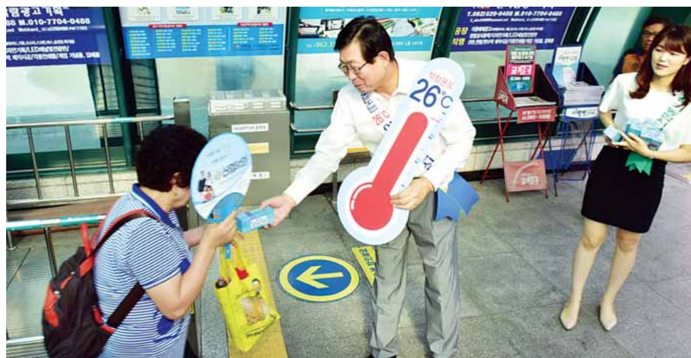
조환의 한전사장이 9일 오전 광주 상무지구 전철역 인근에서 출근길 시민들을 상대로 전기 절약 홍보물을 나눠주며 절전을 당부하고 있다. <한전 제공>

금감원은 내년 1월부터 '파인' 홈페이지 안에 온라인 상담서비스인 '연금 어드바이스'를 연다는 계획이다. /연합뉴스