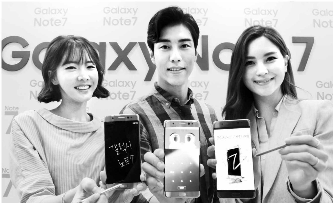
“갤럭시 노트7 나왔어요” 삼성전자 모델들이 11일 서초사옥 다목적홀에서 열린 한국 미디어데이 행사에서 '갤럭시 노트7'을 소개하고 있다.